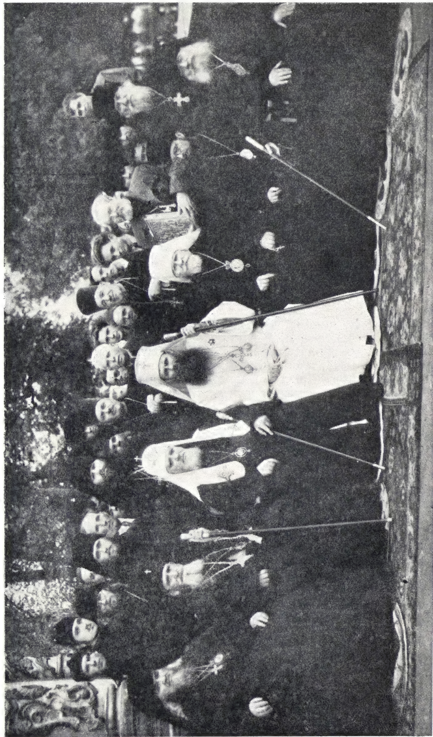
В Троице-Сергиевой Лавре: В центре — Святейший Патриарх Алексей и Святейший Патриарх Юстиниан. Справа: Митрополит Николай, епископ Феодил, епископ Флавиан. Слева: Митрополит Севастриан, епископ Филарет.